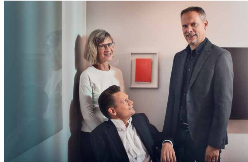
Delar av AMA-redaktionen intill den första utgåvan av AMA från 1950.

Under utredningsarbetet sker löpande kommunikation mellan de externa utredarna och Svensk Byggtjänsts huvudutredare. Komplexa områden kan ibland involvera flera externa utredare och även referensgruppen. Uppstår behov av ändringar i BSAB-systemet tas dessa vidare till ett separat råd som granskar och tar beslut om dessa.